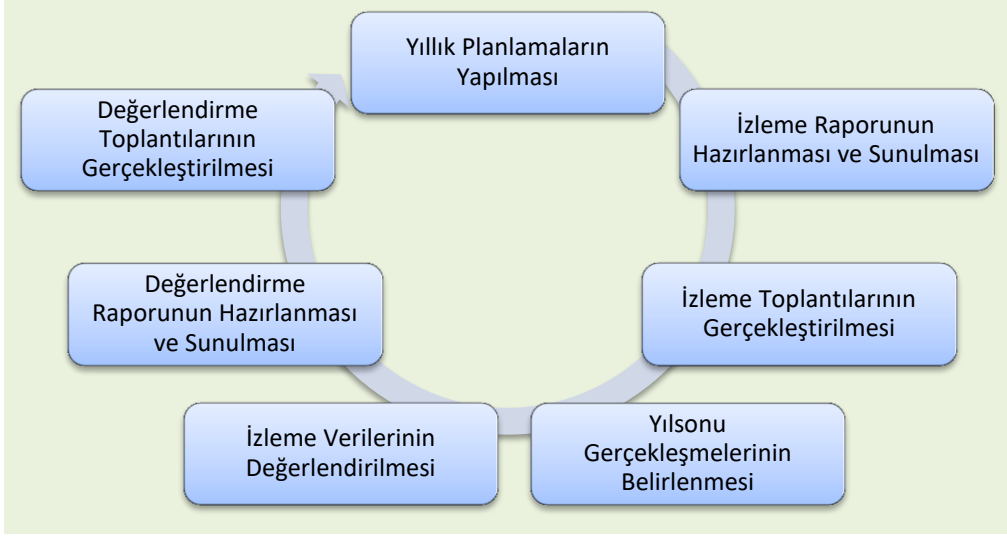
Şekil 3: İzleme ve Değerlendirme Süreci

İzleme ve değerlendirme sürecinin işleyişi ana hatları ile aşağıdaki şekilde özetlenmiştir.